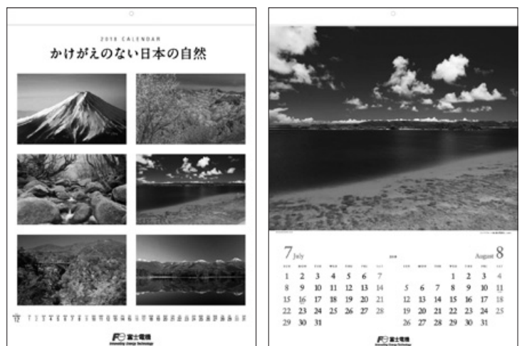
写真は 2018年版カレンダー