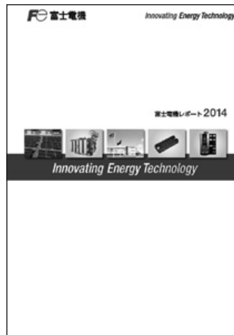
富士電機レポート2014