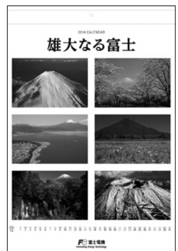
写真は2014年版カレンダー

毎年、ご好評いただいております当社オリジナルカレンダーを今年もご希望の株主様にお届けいたします。是非ご請求ください。