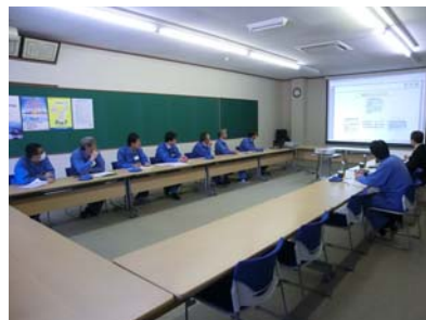
㈱秩父富士におけるグリーンファクトリー評価の様子

水や大気への汚染防止 富士電機は環境汚染を防止するために、化学物質を使用する拠点には処理装置を設置し環境基準より低いレベルで水質等を管理しています。さらに、異常を検知した場合に備えた緊急時の対応訓練を定期的に行っています。また、環境基準を遵守するために、自家発電機(非常用発電機を除く)に処理装置を設置することで大気中へのNOxの排出を抑えています。SOxについては、低硫黄燃料を選択することで大気中への排出を抑制しています。