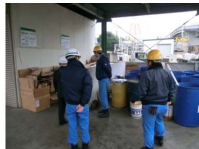
千葉工場における環境巡回の様子

ISO14001は、2015年に改定されました。現在、全ての拠点で期限までの切替計画を策定し取り組みを開始しています。